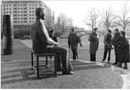
Brecht-Denkmal vor dem Gebäude des Berliner Ensembles , 1988