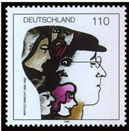
Sondermarke von 1998 der Deutschen Post

„Der größte Dramatiker des 20. Jahrhunderts“, so Marcel Reich-Ranicki über ihn, sei (inzwischen) in Deutschland, statistisch gesehen, wenig bekannt, entsprechend der Interpretation einer repräsentativen Studie (vom Literaturmagazin „bücher“ beim Gewis-Institut) zum 50. Todestag im Jahr 2006. 55 Prozent hatten nur in der Schulzeit Kontakt mit Brechts Werk, in diesem oder im vorigen Jahr haben nur zwei Prozent etwas davon gelesen. 42 Prozent der Bundesbürger haben das noch nie oder erinnern sich nicht daran. Auch Brechts Biographie ist den meisten Deutschen unbekannt. Dass er das Berliner Ensemble gründete, wissen acht Prozent. Drei Prozent denken irrtümlich an die Berliner Schaubühne, die übrigen 89 Prozent haben keine Vorstellung, welches Theater Brecht gegründet haben könnte (1084 Frauen und Männer zwischen 16 und 65 Jahren wurden befragt). [106]