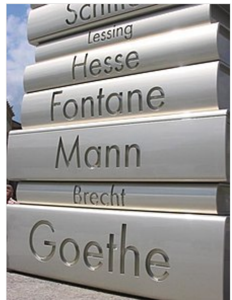
Teil der Skulptur „Der moderne Buchdruck“ beim Berliner Walk of Ideas zur Erinnerung an Gutenbergs Erfindung: Bertolt Brecht gehört in den Kanon mit den bedeutendsten deutschen Schriftstellern.