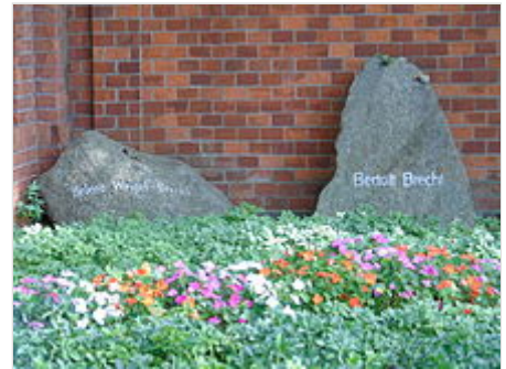
Grabstätte Brecht und Weigel

wurde nicht entsprochen. Stattdessen wurde auf dem eher schlichten Stein ausschließlich sein Name angebracht. [70]