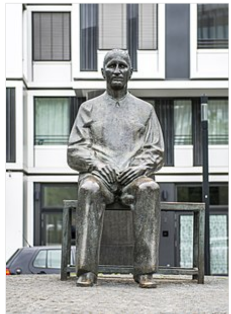
Denkmal Bertolt Brecht von Fritz Cremer auf dem Bertolt-Brecht-Platz in Berlin