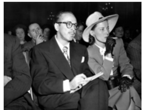
Brecht sitzt hinter Dalton Trumbo vor dem Ausschuss für unamerikanische Umtriebe