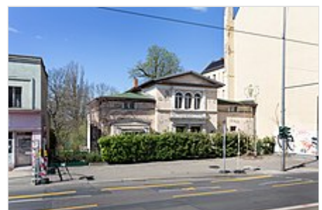
Ehemaliges Wohnhaus Brechts und Weigels (1949–1953) in Berlin-Weißensee (2022)