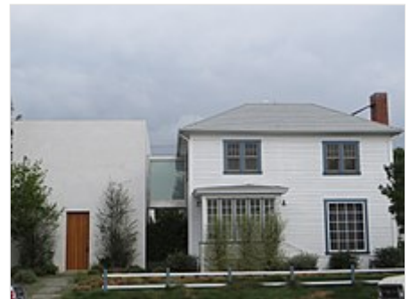
Brechts Haus in Santa Monica, 1063 26th Street (2014)