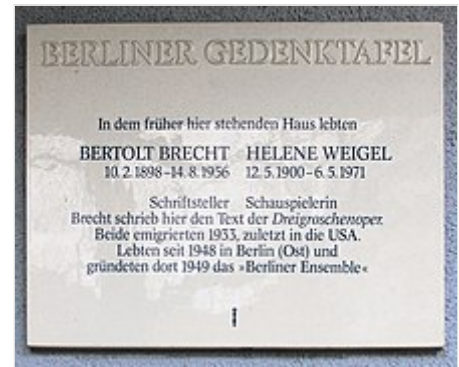
Berliner Gedenktafel am Haus Spichernstraße 16 in Berlin- Wilmersdorf

parteilosen Marxisten wie Karl Korsch , Fritz Sternberg und Ernst Bloch als auch von der offiziellen KPD-Linie beeinflusst. Parallel zur Entwicklung seines politischen Denkens verlief ab 1926 die Bildung seines epischen Theaters. Durch zahlreiche Theaterkritiken, die er in den letzten Jahren schrieb, begann seine Kritik am bürgerlichen deutschen Theater und der Schauspielkunst. Ein wichtiger theatertheoretischer Aufsatz sind die Anmerkungen zur Oper Aufstieg und Fall der Stadt Mahagonny , die Brecht 1930 gemeinsam mit Peter Suhrkamp verfasste. Die Zusammenarbeit mit Kurt Weill in mehreren musikdramatischen Werken war zudem für die Entstehung des epischen Theaters wesentlich.