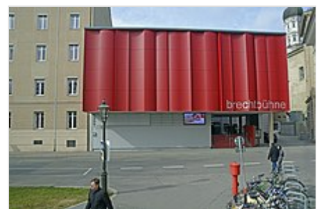
Brechtbühne in Augsburg