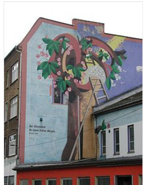
Illustration zu einem Gedicht von Brecht an einer Giebelwand in Berlin-Weißensee, Berliner Allee 177