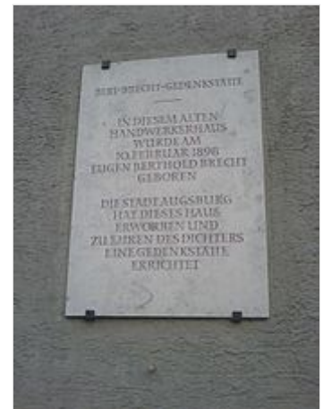
Hinweistafel am Brechtthaus in Augsburg