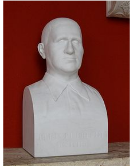
Büste Brechts in der Ruhmeshalle in München

Auf Beschluss des Berliner Senats ist die letzte Ruhestätte von Bertolt Brecht (Grablage: CAM-1-26/29) seit 1997 als Ehrenggrab des Landes Berlin gewidmet. Die Widmung wurde im August 2021 um die übliche Frist von zwanzig Jahren verlängert. [71]