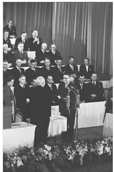
Brecht erhält 1951 die Urkunde zum Nationalpreis I. Klasse von Wilhelm Pieck