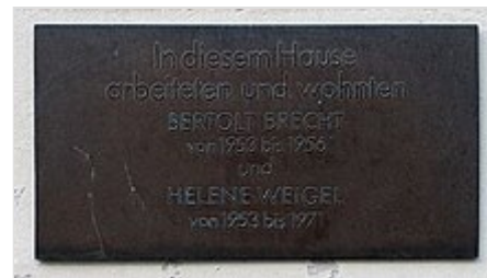
Gedenktafel am Haus Chausseestraße 21 in Berlin-Mitte

Brecht kommentierte die Situation zur selben Zeit in einem unveröffentlichten Typoskript so: „Die Demonstrationen des 17. Juni zeigten die Unzufriedenheit eines beträchtlichen Teils der Berliner Arbeiterschaft mit einer Reihe verfehlter wirtschaftlicher Maßnahmen. Organisierte faschistische Elemente versuchten, diese Unzufriedenheit für ihre blutigen Zwecke zu missbrauchen. Mehrere Stunden lang stand Berlin am Rande eines Dritten Weltkrieges . Nur dem schnellen und sicheren Eingreifen sowjetischer Truppen ist es zu verdanken, daß diese Versuche vereitelt wurden. Es war offensichtlich, daß das Eingreifen der sowjetischen Truppen sich keineswegs gegen die Demonstrationen der Arbeiter richtete. Es richtete sich augenscheinlich ausschließlich gegen die Versuche, einen neuen Weltbrand zu entfachen. Es liegt jetzt an jedem einzelnen, der Regierung beim Ausmerzen der Fehler zu helfen, welche die Unzufriedenheit hervorgerufen haben und unsere unzweifelhaft großen sozialen Errungenschaften gefährden.“ [51]