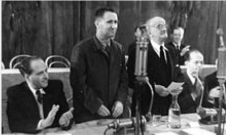
Bertolt Brecht (zweiter von links) auf der Friedenskundgebung des Kulturbundes 1948

Bereits kurz nach dem Krieg wurde Brecht von Freunden gedrängt, nach Deutschland zurückzukommen und seine Stücke selbst zu inszenieren. Er wartete jedoch in Zürich noch ab und sondierte die Lage. Als 1948 in der sowjetischen Besatzungszone mehrere Theater wiedereröffnet wurden und auch das „Deutsche Theater“ und die Volksbühne die Arbeit wieder aufnahmen, reiste er im Oktober 1948 auf Einladung des Kulturbundes zur demokratischen Erneuerung Deutschlands von Zürich über Prag nach Berlin. Die Einreise in die westlichen Besatzungsgebiete Deutschlands blieb ihm nach wie vor untersagt. In Ost-Berlin angekommen, fand er schnell Kontakt zu maßgeblichen Künstlern und Funktionären. Auch dass mit Alexander Dymshitz ein Verehrer seiner Werke in