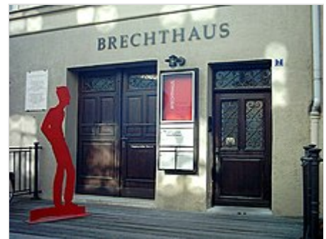
Geburtshaus des Dichters in Augsburg (sogenanntes Brechtthaus )