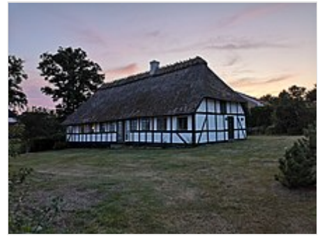
Brechts Haus in Svendborg (2019)

Nach dem Kriegseintritt der USA musste sich Brecht 1942 als „ Enemy Alien “, als feindlicher Ausländer, registrieren lassen und wurde vom FBI überwacht. [38] Unter dem Verdacht, Mitglied einer kommunistischen Partei zu sein, wurde er am 30. Oktober 1947 vom Ausschuss für unamerikanische Umtriebe befragt. [39] Die Frage, ob er jemals Mitglied der Kommunistischen Partei gewesen sei oder noch gegenwärtig sei, beantwortete Brecht mit „nein“ und ergänzte, er sei auch nicht Mitglied einer kommunistischen Partei in Deutschland. Einen Tag später reiste er nach Paris und kurz darauf am 5. November nach Zürich. Dort hielt er sich ein Jahr auf, da die Schweiz das einzige Land war, für das