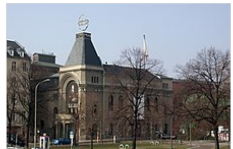
Theater Berliner Ensemble am Schiffbauerdamm